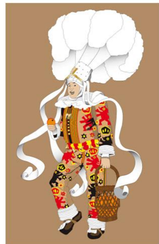
Gilles de Binche

Le Mardi Gras étant le seul jour de sortie des célèbres Gilles, les rues de la ville seront en liesse, sous les yeux émerveillés des Binchois et des touristes !